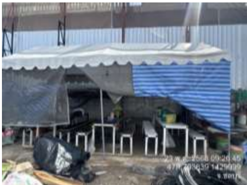
รูปที่ 36 พื้นที่พักคนงานช่วงเวลากลางวัน