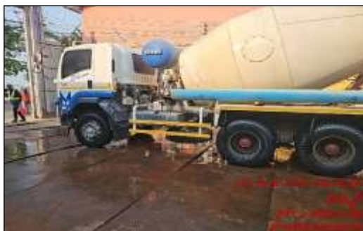
รูปที่ 10 รถผสมปูน