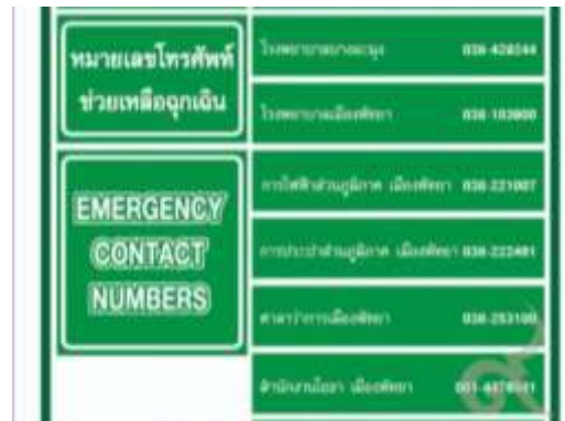
รูปที่ 47 เบอร์โทรฉุกเฉิน