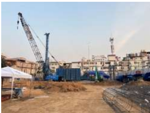
รูปที่ 17 การเจาะเสาเข็ม