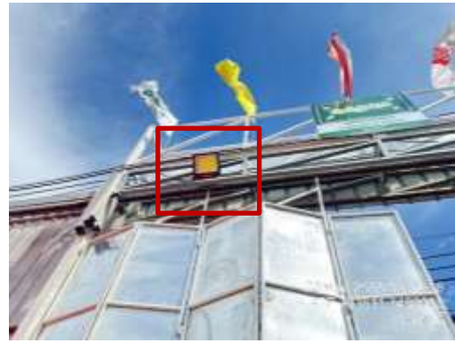
รูปที่ 2 ไฟฟ้าส่องสว่าง