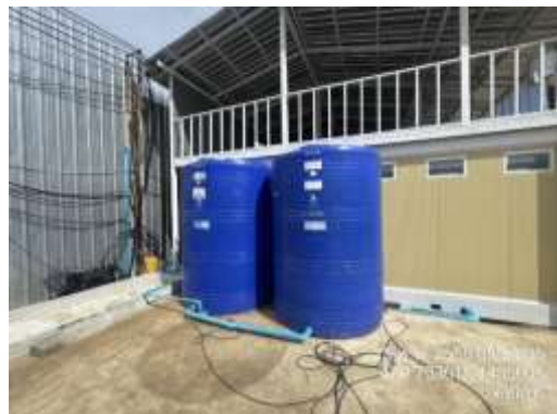
รูปที่ 18 ถังสำรองน้ำ