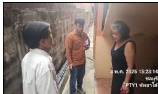
รูปที่ 6 เจ้าหน้าที่เข้าพบผู้พักอาศัยข้างเคียง