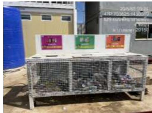
รูปที่ 11 พื้นที่จัดเก็บเศษวัสดุ