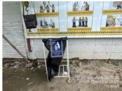
รูปที่ 16 ถังรองรับมูลฝอย