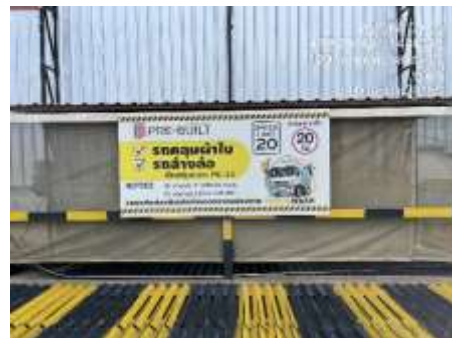
รูปที่ 43 ป้ายจำกัดความเร็ว