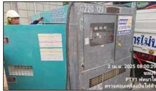
รูปที่ 40 ตรวจสอบเครื่อง Ganagerator