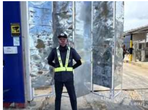
รูปที่ 15 เจ้าหน้าที่รักษาความปลอดภัย (รปภ.)