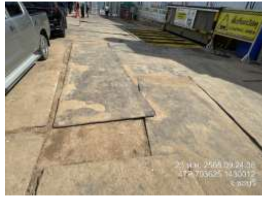
รูปที่ 31 แผ่นเหล็กสำหรับทางวิ่งรถ