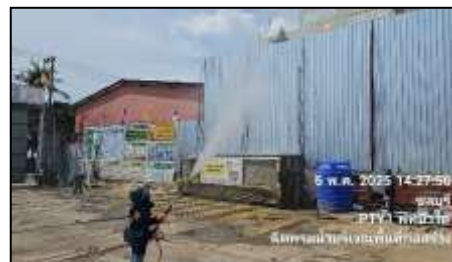
รูปที่ 9 สเปรย์น้ำ