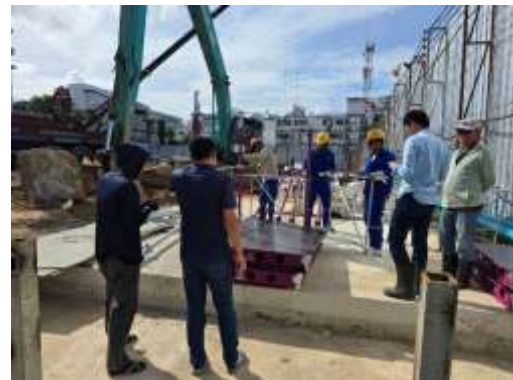
รูปที่ 5 วิศวกรควบคุมการก่อสร้าง