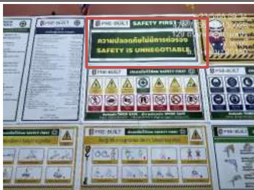
รูปที่ 38 ป้ายสถิติความปลอดภัย