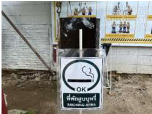
รูปที่ 27 พื้นที่สูบบุหรี่