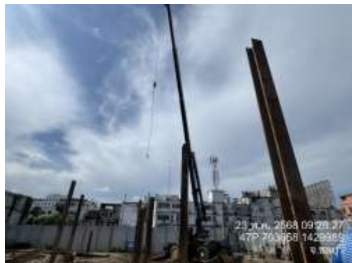
รูปที่ 44 ทาวเวอร์เครน