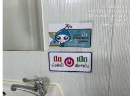
รูปที่ 24 ป้ายรณรงค์ประหยัดไฟ