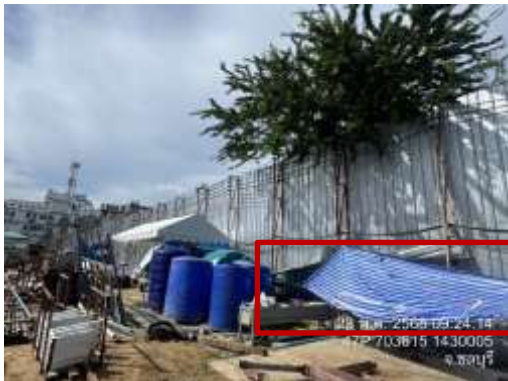
รูปที่ 14 ผ้าใบปิดคลุมวัสดุก่อสร้าง