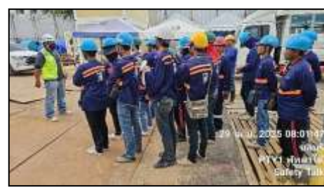
รูปที่ 20 กิจกรรมอบรม Safety Talk