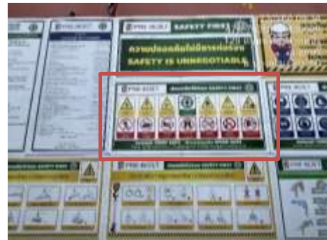
รูปที่ 49 ติดตั้งป้ายสัญลักษณ์เตือนอันตราย