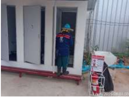
รูปที่ 23 คนงานทำความสะอาดห้องส้วม