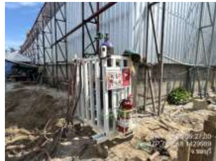
รูปที่ 35 พื้นที่จัดเก็บวัตถุไวไฟ