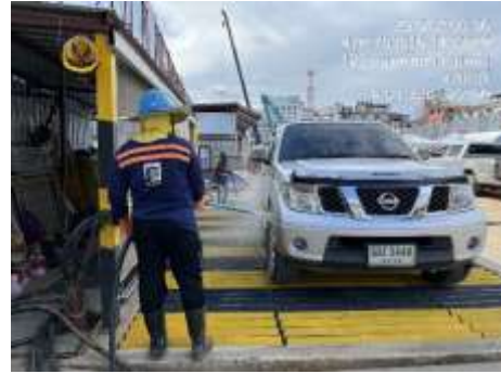
รูปที่ 13 คนงานทำความสะอาดล้อรถบรรทุก