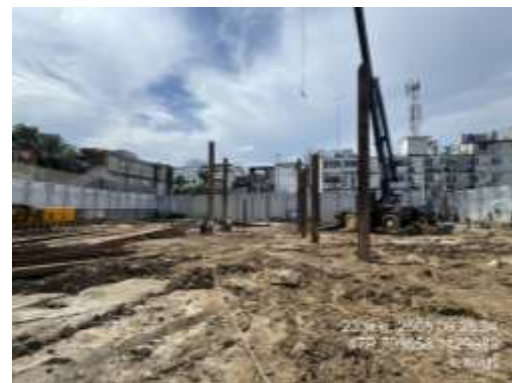
รูปที่ 1 ติดตั้งรั้ว Metal Sheet รอบพื้นที่โครงการ