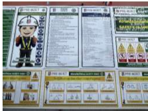
รูปที่ 26 ฎระเบียบพื้นที่ก่อสร้าง