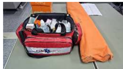
รูปที่ 39 อุปกรณ์ปฐมพยาบาลเบื้องต้น