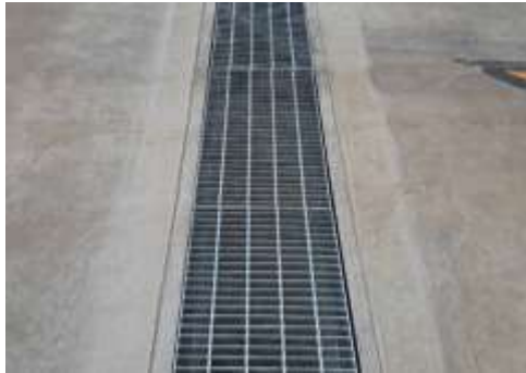
รูปที่ 46 รางระบายน้ำรอบโครงการ