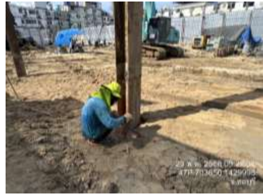
รูปที่ 33 อุปกรณ์ป้องกันอันตรายส่วนบุคคล