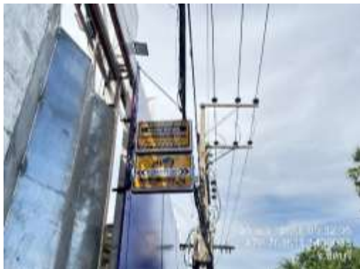
รูปที่ 42 ป้าย “โปรดระมัดระวัง มีรถบรรทุกทุกเข้า-ออก