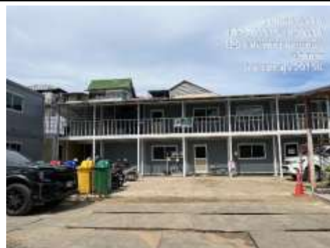
รูปที่ 51 (ต่อ) พื้นที่จอดรถภายในโครงการ