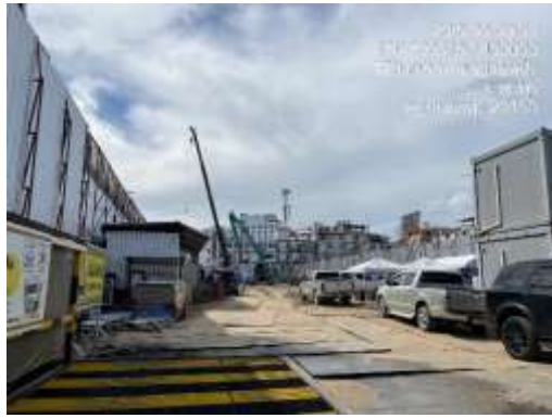
รูปที่ 30 พื้นที่จอดรถขนส่งวัสดุก่อสร้าง