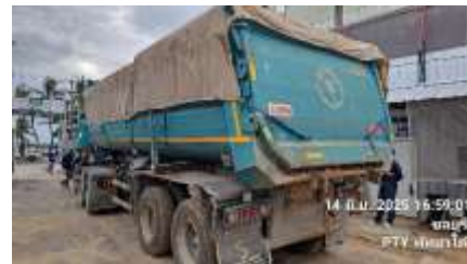
รูปที่ 8 ผ้าใบปิดคลุมท้ายรถบรรทุก