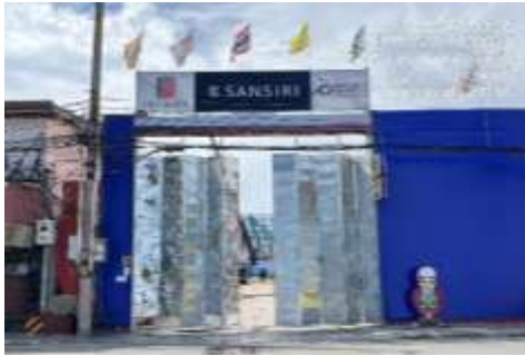
รูปที่ 12 ประตูทางเข้า-ออกโครงการ