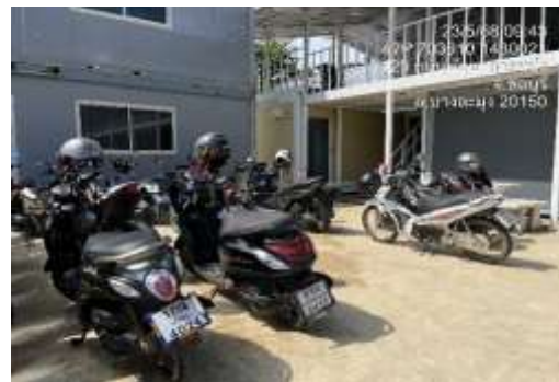
รูปที่ 51 พื้นที่จอดรถภายในโครงการ