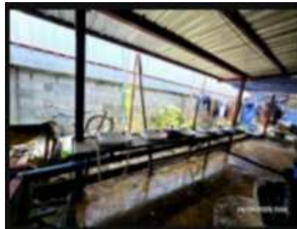
รูปที่ 32 บ้านพักคนงาน