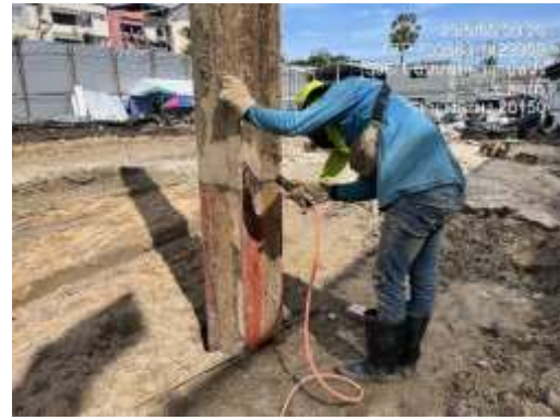
รูปที่ 19 คนงานสวมใส่อุปกรณ์ป้องกันอันตรายส่วนบุคคล