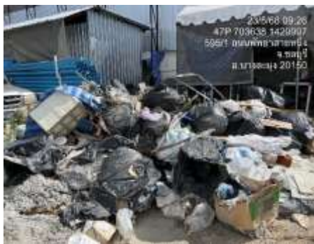
รูปที่ 50 เศษวัสดุก่อสร้าง