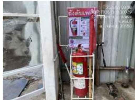
รูปที่ 28 ถังดับเพลิง