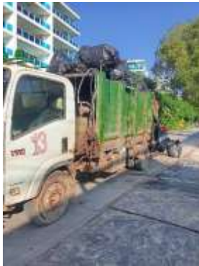
รูปที่ 34 รถจัดเก็บขยะมูลฝอย