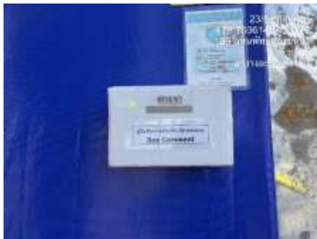
รูปที่ 4 ช่องทางการรับเรื่องร้องเรียน