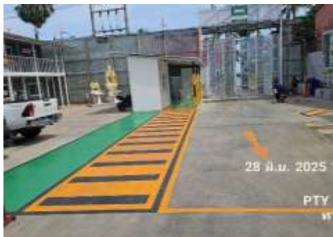
รูปที่ 48 ลูกศรแสดงทิศทางการเข้า-ออก