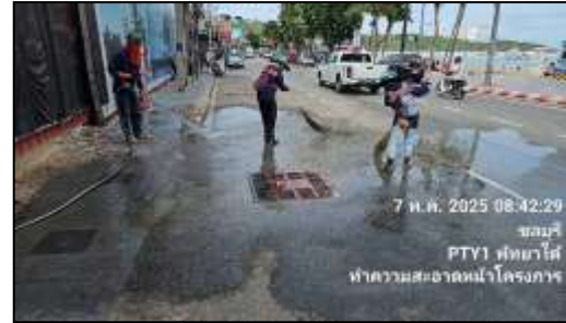
รูปที่ 7 คนงานทำความสะอาดถนนด้านหน้าโครงการ