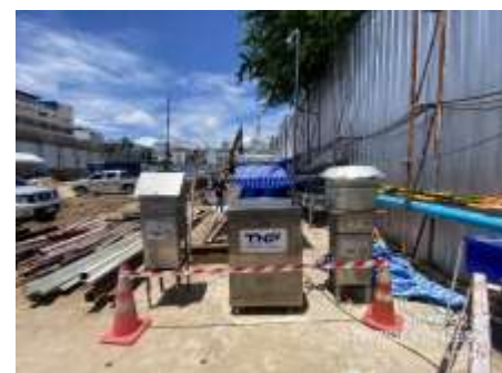
รูปที่ 45 เครื่องตรวจวัดอากาศ