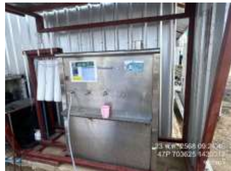
รูปที่ 37 น้ำดื่ม