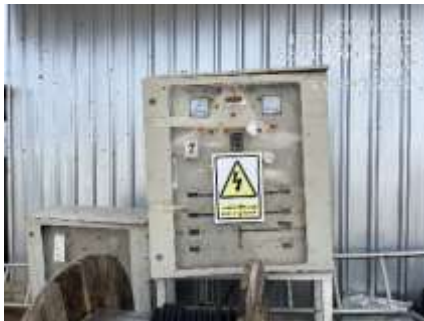
รูปที่ 25 ช่างเทคนิคดูแลระบบไฟฟ้า