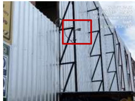
รูปที่ 41 กล้องวงจรปิด