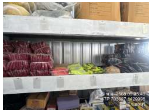
รูปที่ 29 ห้องสโตร์